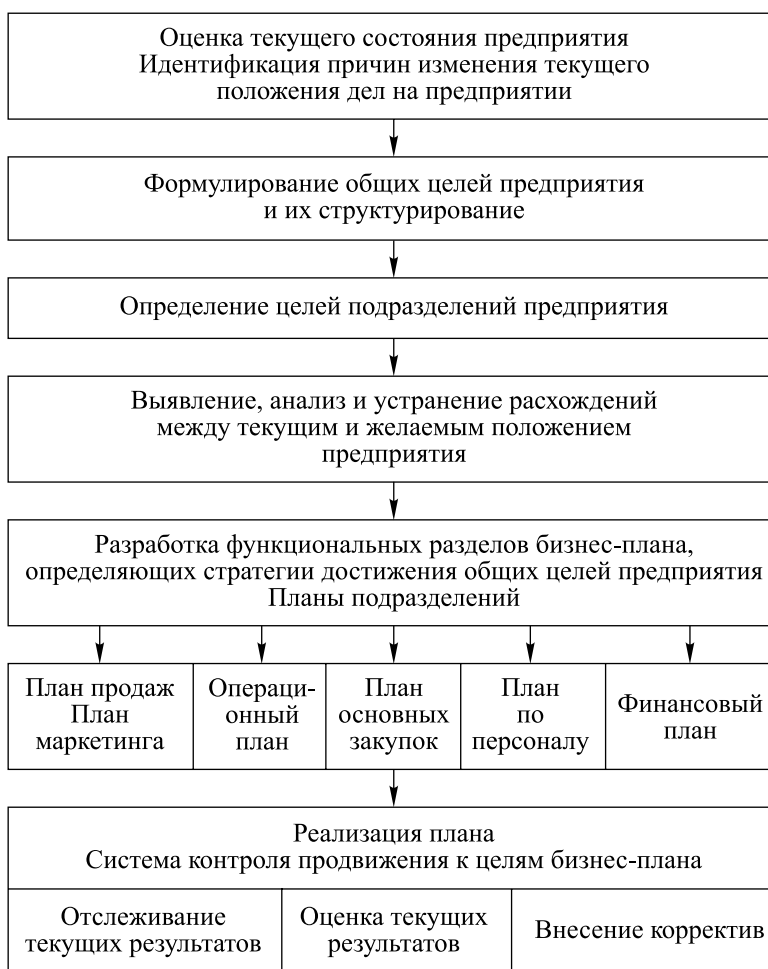
Рис. 2. Общий алгоритм разработки и реализации управленческого бизнес-плана

На основе общей цели (или целей) предприятия определяются частные цели структурных подразделений, которые конкретизируют их задачи. Основным моментом здесь является смещение внимания с автономно работающего подразделения на понимание общей цели предприятия. На малых (средних) предприятиях это достигается гораздо легче, чем на крупных.